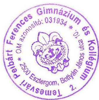
Szánthó Gellért mb. igazgató