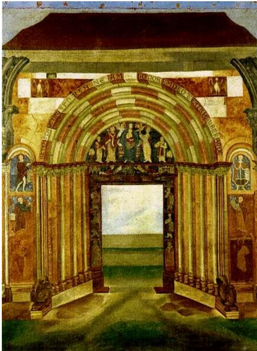
Esztergom: a III. Béla által épített „porta speciosa”

Egyes szaktudósok szerint csak III. Béla halála után, de még Jób érsek halála, azaz 1203 előtt kerülhetett az országfelajánlás jelenete a timpanonba. Bár eredetileg a Deészisz volt ide tervezve, a körülmények megváltozása miatt ez az ábrázolás végül a kapuzat belső oldalára került. Nem is fért el az új helyén, ezért le kellett faragni belőle.